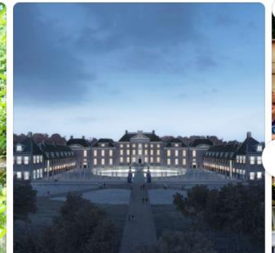
Paleis Het Loo