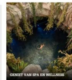
GENIET VAN SPA EN WELLNESS