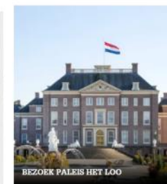
BEZOEK PALAIS HET LOO