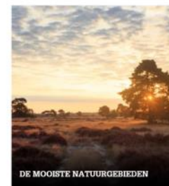
DE MOOISTE NATUURGEBIEDEN