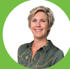
Reinou de Haan Merkleider Veluwe