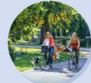
Park langs kastelen

De 'Nieuwmarkt' is bekend om 'Gedraaide Aardbei'. Het is de ideale plek voor de hele familie om te genieten van de zon en de zand. Het is de ideale plek voor de hele familie om te genieten van de zon en de zand.