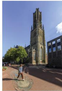
Er valt oneindig veel te zien en doen in de regio Arnhem.

Er valt oneindig veel te zien en doen in de regio, dus blijf vooral een nachtje slapen. Altijd al willen logeren in een kasteel, of word je liever wakker in een knusse b&B? Er is voor ieder wat wils – je vindt hier de leukste hotels, in de natuur én de stad.