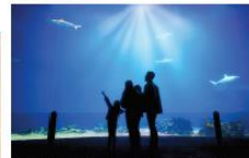
Duik onder in de tropische koraalzee bij Dierenpark Burgers' Zoo. Beleef een onvergetelijke avond uit in Muziek & Stadstheater Arnhem ontmoet je lokale helden, gepassioneerde artiesten en absolute wereldsterren. Van klassieke muziek tot dance en pop en van cabaret tot toneel en dans: hier beleef je het allemaal. Waar ga jij voor?

Bij dierenpark Burgers' Zoo ontdek je tijdens een avontuurlijke wandeling de meest uiteenlopende natuurgebieden ter wereld. Duik onder in de tropische koraalzee (Ocean), verken het tropisch regenwoud (Bush) en de Oost-Afrikaanse savanne (Safari). En met een bezoek aan Burgers' Zoo draag je ook nog eens bij aan natuurbehoud door het dierenpark verschillende projecten over de hele wereld steunt.