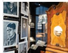
In het Airborne Museum ontdek je de geschiedenis van de regio.

In het Airborne Museum duik je in de geschiedenis van de regio en beleef je de Slag om Arnhem als nooit tevoren. Vul je museumbezoek aan met één van de volgende activiteiten: een rondleiding over de Airborne Begraafplaats of wandel met een gids mee in de voetstapen van de geallieerden tijdens de perimeterswaling.